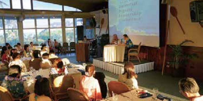
Hawaii Universal Dignity Leadership Conference ハワイ・ディグニティ・リーダーシップ・カンファレンス