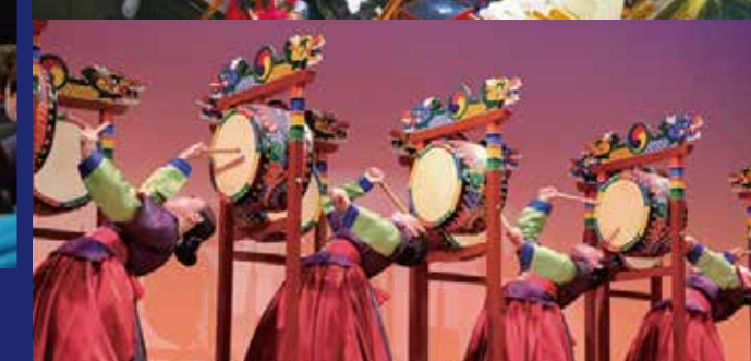
Various cultural activities; cross-cultural events 様々な文化活動:国際交流イベント