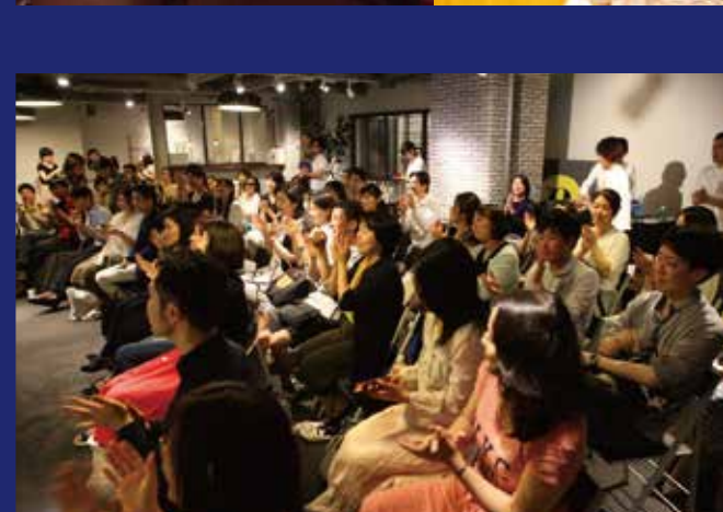
nTech Workshop nTechワークショップ