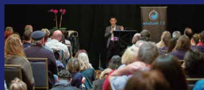
Presentation at wisdom 2.0 "0=∞=1: the Deepest Wisdom of Human Mind, which Reveals the Secret of the Universe" wisdom 2.0でのプレゼンテーション "0=∞=1: 宇宙の秘密を解き明かす、もっとも深遠な心の智慧"