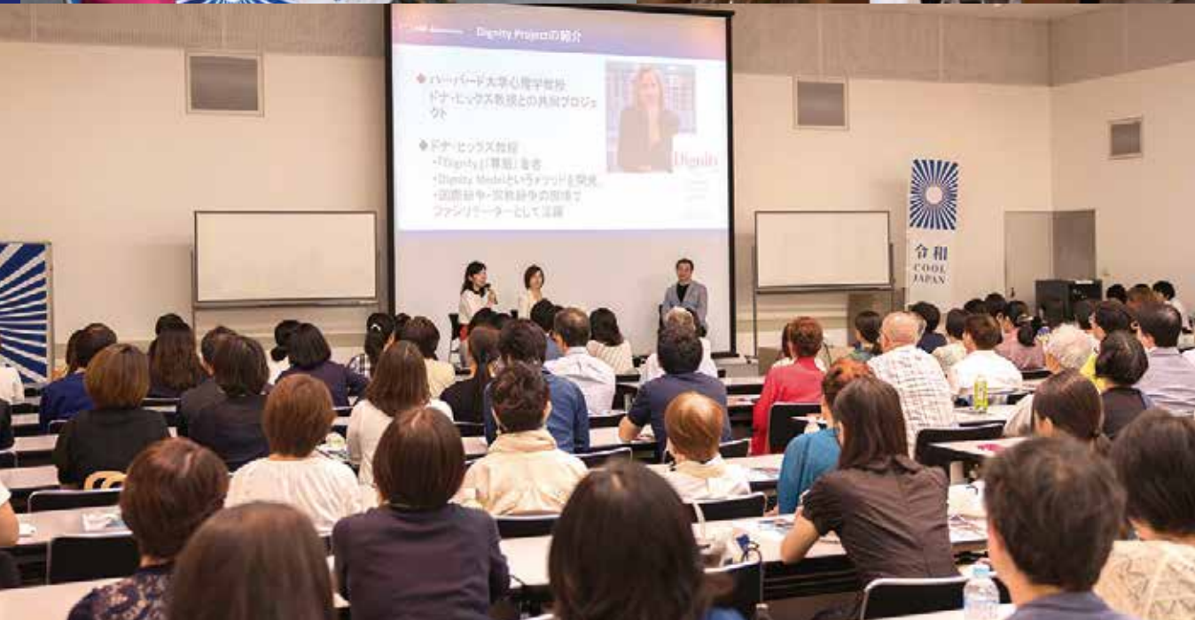
Project to Dignity 2.0 Dignity 2.0プロジェクト