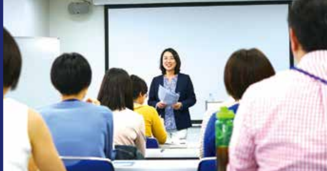
Seminar for corporations 企業向けセミナー