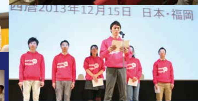
Other events and conferences その他イベント・カンファレンス